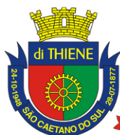
São Caetano do Sul