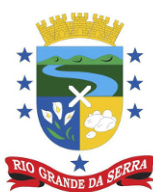
Rio Grande da Serra