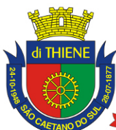
São Caetano do Sul