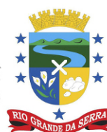
Rio Grande da Serra